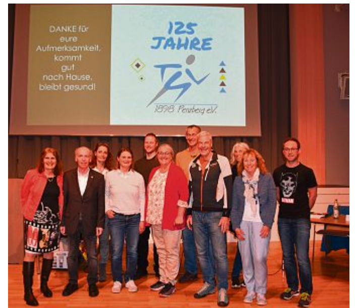
Die aktuelle Vorstandschaft seit der Wahl im Mai 2023.

Nachdem schon einige Jahre ohne Ergebnis von der Gründung eines Vereins gesprochen worden war, riefen am 18. Juni 1898 40 Männer, mit Obersteiger Karl Goldner an der Spitze, in der „Baderestaurations“ an der heutigen Ludwig-März-Straße, den TSV Penzberg ins Leben. Goldner bekleidete das Amt des 1. Vorsitzenden, Bürgermeister Schönleben stellte den Saal der „Baderestaurations“ und den Platz vor der Gaststätte als Übungsstätten zur Verfügung und in einem der ersten Beschlüsse wurde festgelegt, 600 Mark für den Kauf von Geräten wie Matten, feste Turngeräten und eine Büste von Turnvater Jahn bereit-