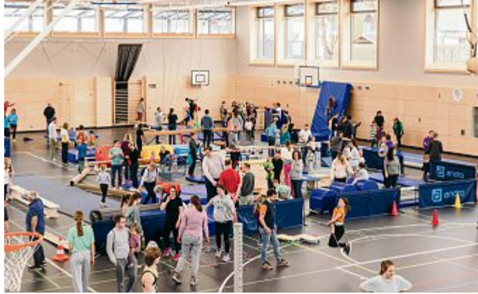
TSV „Funpark indoor“ – das Outdoor-Event findet am 18.6. auf der Berghalde statt.