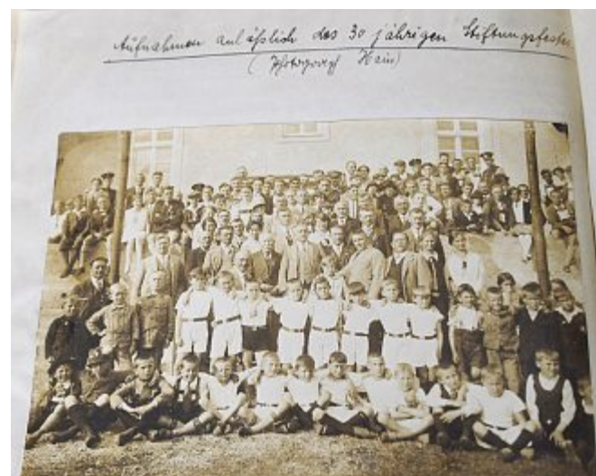
Das 30 jährige Stiftungsfest wurde kräftig gefeiert.

lange im Amt. Alle Bergleute zogen sich aus dem TSV zurück, zu groß waren scheinbar die gesellschaftlichen Unterschiede zwischen den „Klassen“. Doch der körperlichen Betätigung tat das keinen Abbruch: bereits im August 1900 waren 18 Vereine beim Gauturnfest zu Gast. Nach weiteren Vorstandswechseln beruhigte sich das Vereinsleben allmählich und bis 1907 blieb alles stabil. 1906 mussten die Mitglieder einen Betrag von 1 Mark für Strom an die Wirtsleute abgeben und Heizmaterial im Winter selbst beitragen. 1906 beschloss man den Bau einer eigenen Turnhalle, worauf die Sportler allerdings auf Grund der hohen Kosten noch 20 Jahre warten mussten. Am 16. Mai 1926 war es so weit, die Grundsteinlegung der „Barbara-Turnhalle“ erfolgte. Rund 50.000 Mark soll sie gekostet haben, der Vereinsbeitrag wurde kurzzeitig von 6 auf 12 Mark erhöht, diese unerhörte Verteuerung allerdings wieder zurückgenommen. Rechtzeitig vor dem Winter 1927 konnten die Turner dann dort ihren Sport aus-